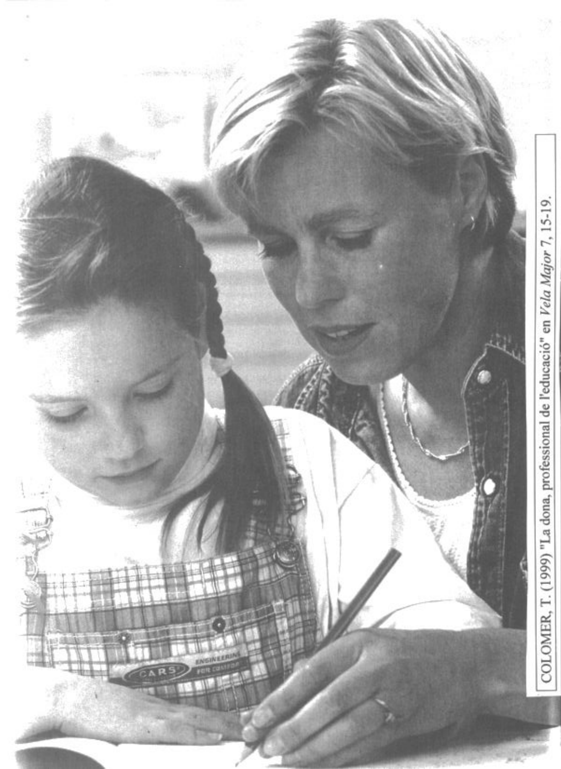
COLOMER, T. (1999) "La dona, professional de l'educació" en Vela Major 7, 15-19.